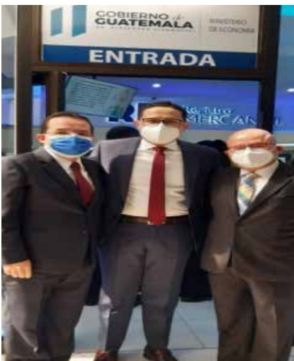
Autoridades del Viceministerio de Asuntos Registrales; Autoridades del Registro Mercantil; y del Instituto Guatemalteco de Derecho Notarial.