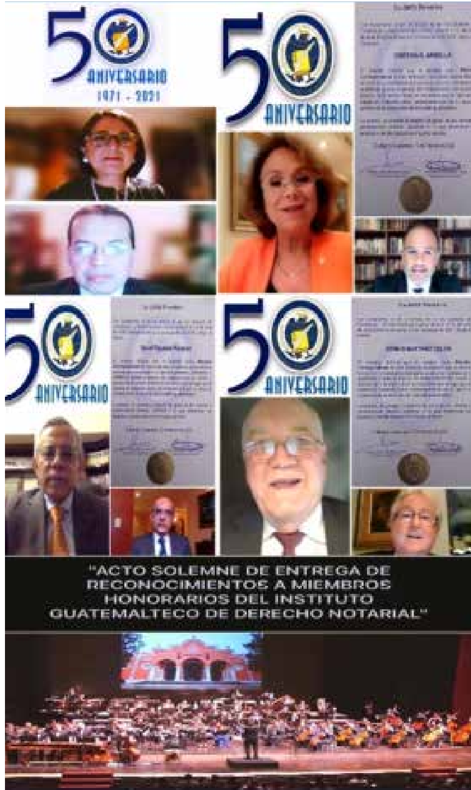
"ACTO SOLEMNE DE ENTREGA DE RECONOCIMIENTOS A MIEMBROS HONORARIOS DEL INSTITUTO GUATEMALTECO DE DERECHO NOTARIAL"

Durante el desarrollo del mismo se contó con la participación de importantes juristas y notarios de talla internacional, a quienes ratificamos nuestro agradecimiento por el apoyo al desarrollo de las actividades así programadas.